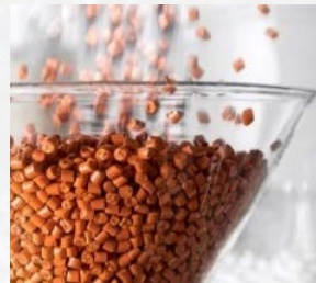
Functional Materials & Solutions