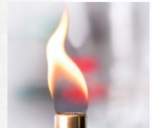
Oil & Gas